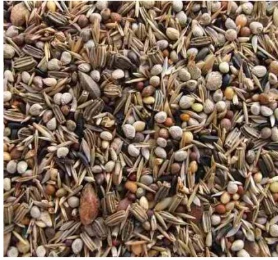
mixtura de spinus