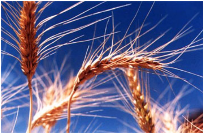
Espigas de trigo