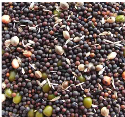
semillas para germinar