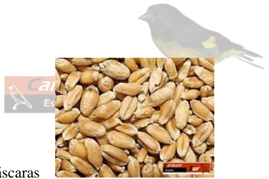
Arroz con cáscaras