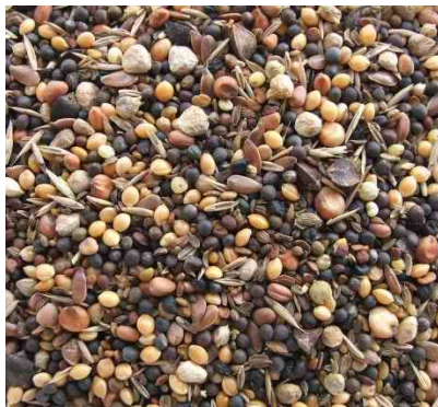
semillas de prado (semillas de la salud)