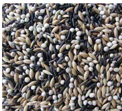
mixtura de cardenalitos

Fotos de tipos de mezclas de semillas (mixturas)