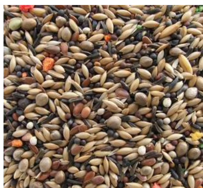
mixtura de jilgueros