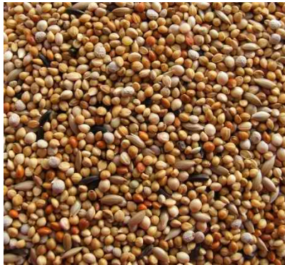
mixtura de exóticos africanos