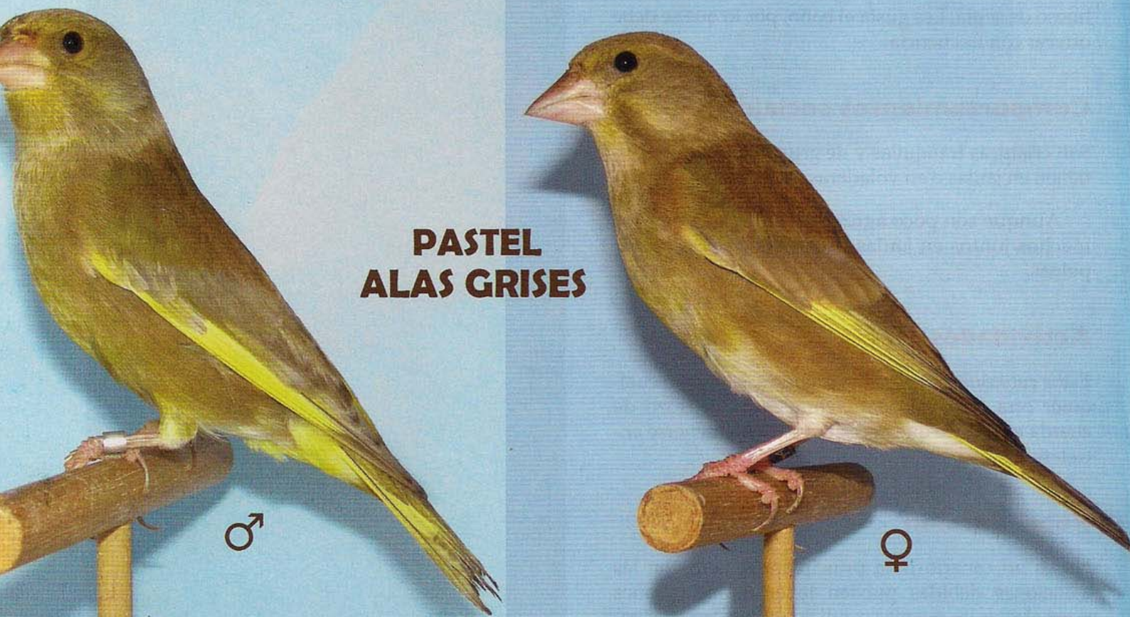
Foto 1. Pareja de verderones comunes mutación pastel alas grises.